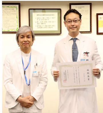
受賞したPFMセンター

優れた基礎研究の成果を革新的な医薬品・医療機器などとして国民に提供することを目指す「橋渡し研究支援機関」の認定および、医学・歯学・薬学系以外の先端技術・知識を利活用することで、医療イノベーションを推進する「橋渡し研究プログラム(異分野融合型研究開発推進支援事業)」の拠点認定に貢献した。