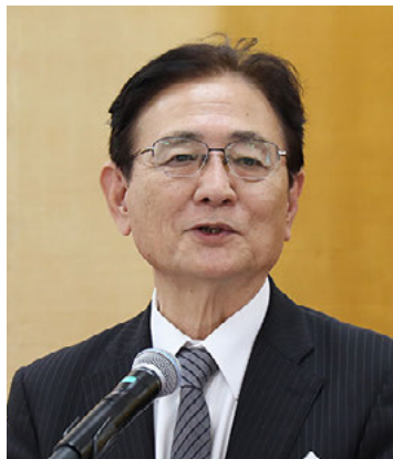
挨拶をする湊総長