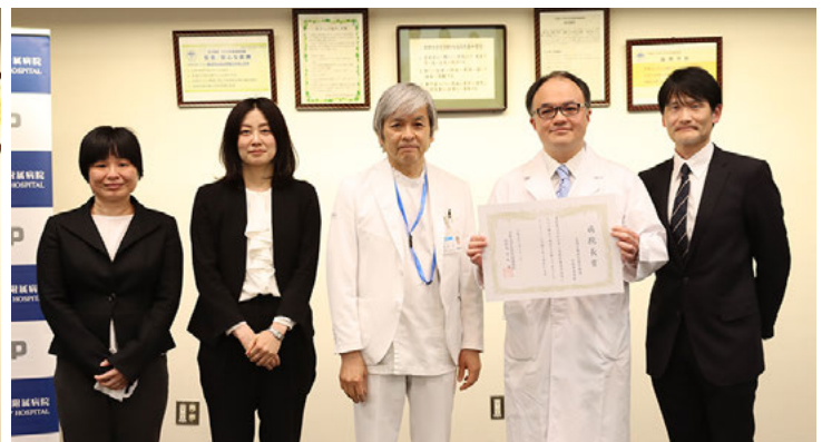
受賞した先端医療研究開発機構医療開発部