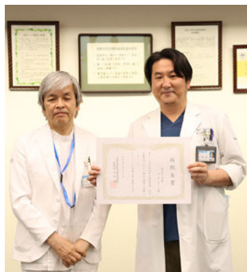
受賞した摂食嚥下診療センターチーム