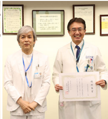
受賞した京都大学肺移植チーム