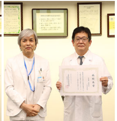
受賞した肝胆膵・移植外科/小児外科